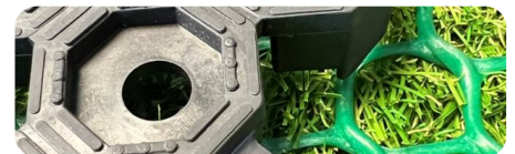
Dalle 23 mm + grille de renfort