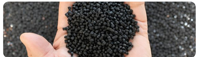
Matière première régénérée