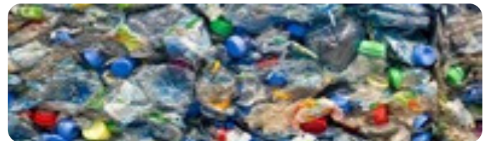
Granulat de PVC issu du recyclage